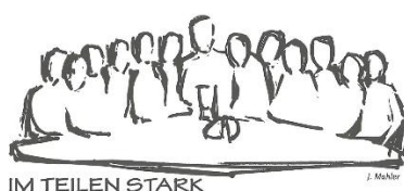
IM TEILEN STARK