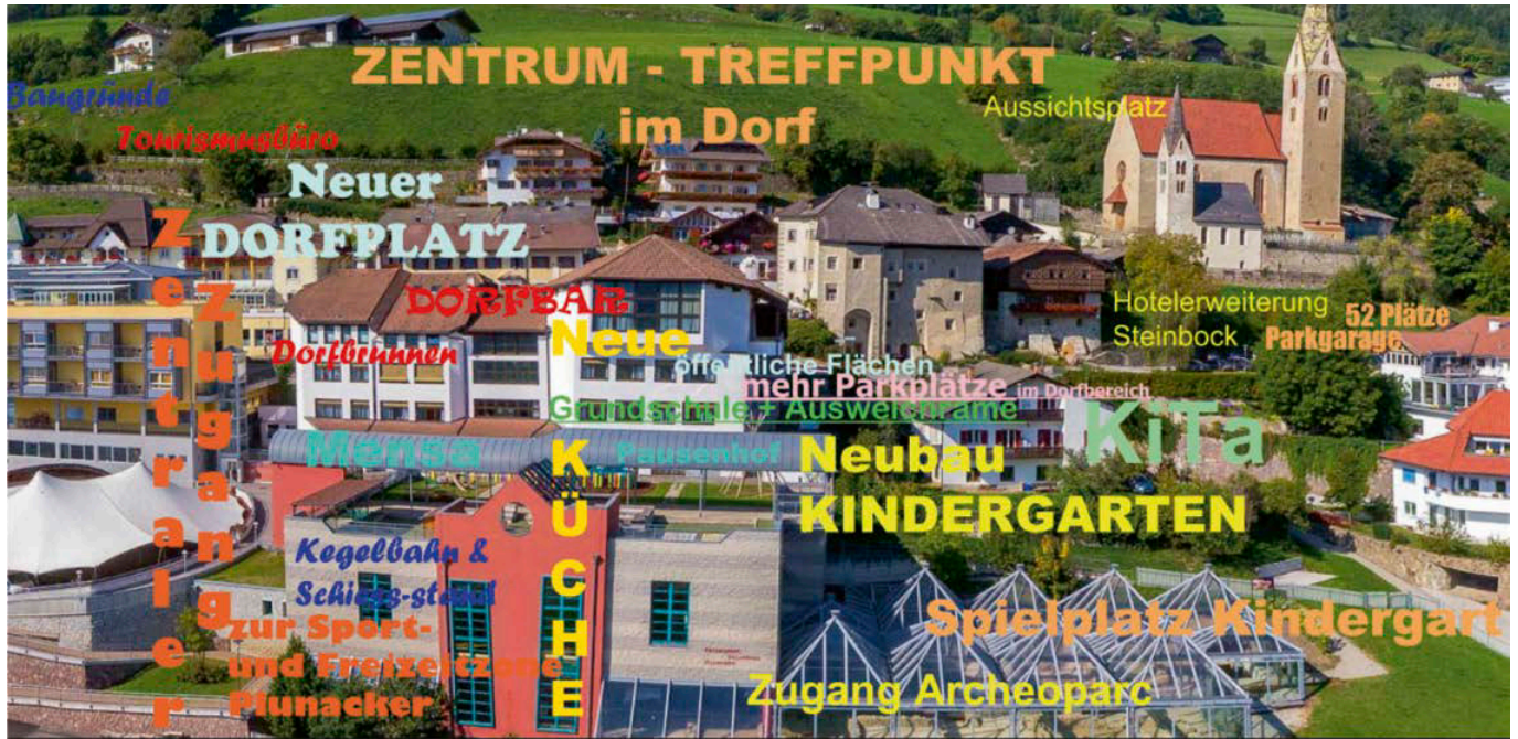
Ideen zur Erneuerung des Dorfzentrums

Bei der Bürgerversammlung vom 13. März 2019 wurden Ideen für die Gestaltung des Dorfzentrums gesammelt. In einer Arbeitsgruppe, die vom Gemeinderat ernannt wird, sollen die Ideen konkretisiert werden. Alle Bürger sind aufgerufen Ideen einzubringen und sich an dem umfangreichen Planungsprozess zu beteiligen.